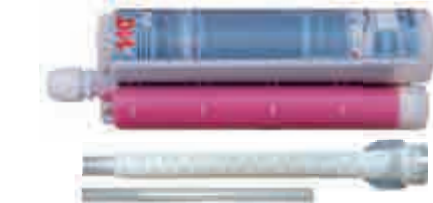
Kartusche VME 585 Side-by-side Kartusche Inhalt: 585ml Mit großem Mischer VM-XL und Reduzier-/Verlängerungsrohr für Bohrlöcher ab 12mm Durchmesser