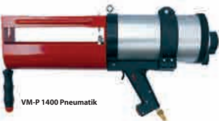
VM-P 1400 Pneumatik