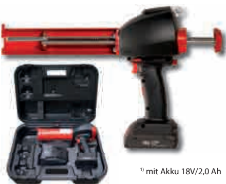
1) mit Akku 18V/2,0 Ah

➔ Bohrlochreinigung Injektionssystem VME (ETA-09/0350) für Bohrlöcher Ø10mm - Ø18mm bis Bohrtiefe 240mm