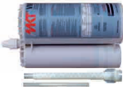
Kartusche VME 1400 Side-by-side Kartusche Inhalt: 1400ml Mit großem Mischer VM-XL und Reduzier-/Verlängerungsrohr für Bohrlöcher ab 12mm Durchmesser

Lastbereich: 3,1 - 128 kN Betongüte: C20/25 - C50/60 Material: Stahl verzinkt, Stahl feuerverzinkt, Edelstahl A4, Edelstahl HCR BSt 500 S