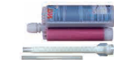
Kartusche VME 385 Side-by-side Kartusche Inhalt: 385ml Mit großem Mischer VM-XL und Reduzier-/Verlängerungsrohr für Bohrlöcher ab 12mm Durchmesser